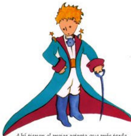
Aquí tienen el mejor retrato que más tarde logré hacer de él

Me puse en pie de un salto como herido por el rayo. Me froté los ojos. Miré a mi alrededor. Vi a un extraordinario muchachito que me miraba gravemente. Ahí tienen el mejor retrato que más tarde logré hacer de él, aunque mi dibujo, ciertamente es menos encantador que el modelo. Pero no es mía la culpa. Las personas mayores me desanimaron de mi carrera de pintor a la edad de seis años y no había aprendido a dibujar otra cosa que boas cerradas y boas abiertas.